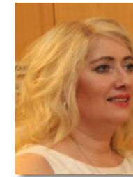
Varaformaður Óluf Þórðardóttir Reykjanesbæ