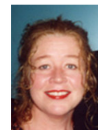
Skólanefnd Hrunn Ólafsdóttir Reykjavík