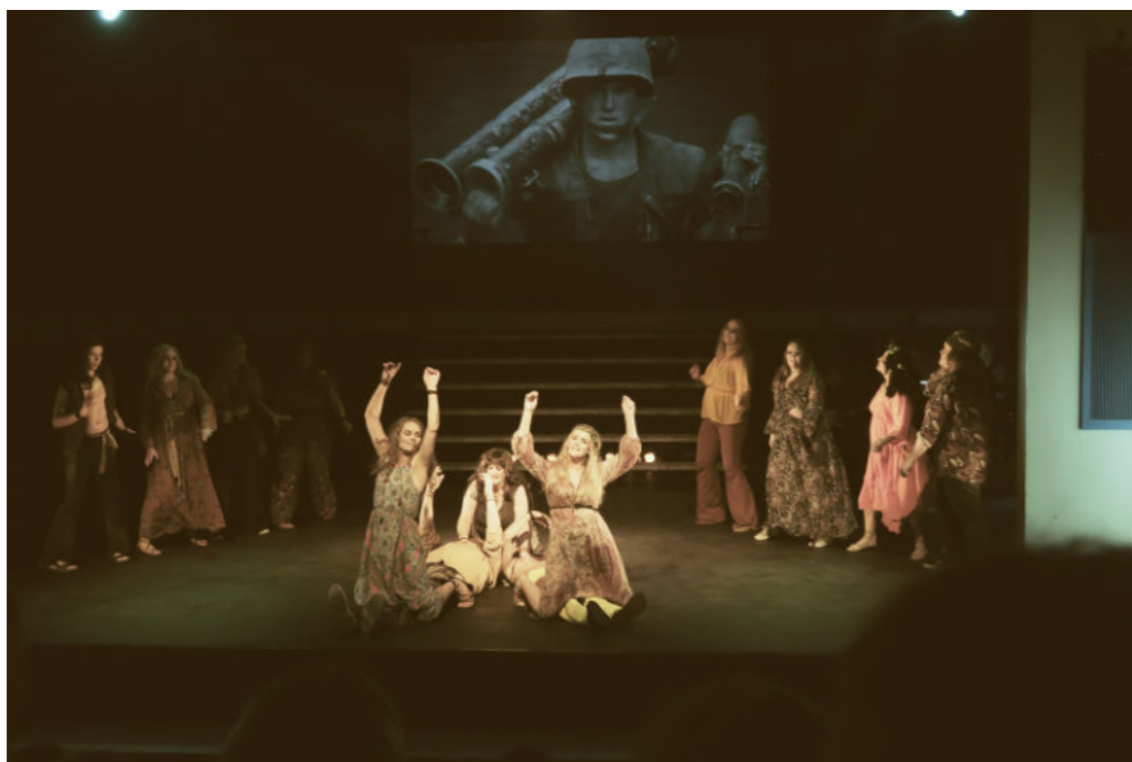
Hárið í flutningi Leikflokks Húnaþings vestra Athyglisverðasta áhugaleiksýning ársins 2019

“... við tökum ótrauð upp þráðinn að nýju á næsta leikári!”