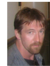
Framkvæmdastjóri Hörður Sigurðarson Reykjavík