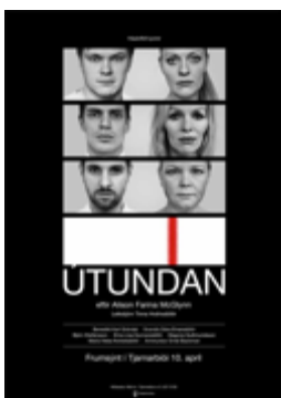
Háaloftið - Útundan

Tekinn verða lög af nýútkominni plötu You Sound Asleep sem kom út á Möller Records 13. febrúar.